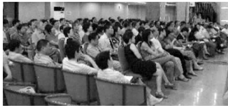
图为9月15日活动现场

懈。在股民学校学习中,投资者教育与营业部日常工作结合起来,以投资者乐于接受的方式开展,使投资者在轻松的交流中学到证券投资的知识,并提高风险防范意识。