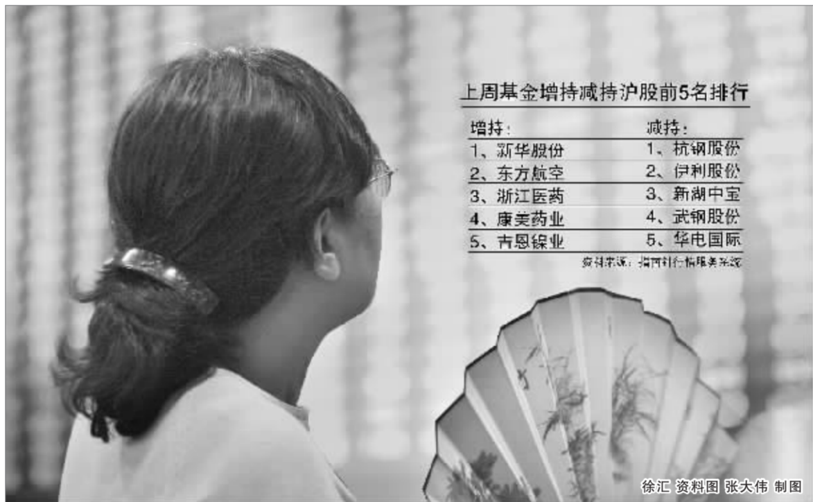
上周基金增持减持沪股前5名排行

数据还提示,基金上周在沪市总共净买入638.89亿元,净卖出565.96亿元,合计净投入资金72.94亿元。这点资金量与于前几周动辄三、四百亿的投放量相比,可以说是急剧萎缩。我们知道,公募基金最近正在快速扩张,规模逼近3万亿元,如此“吝啬”,固然有其对估值泡沫