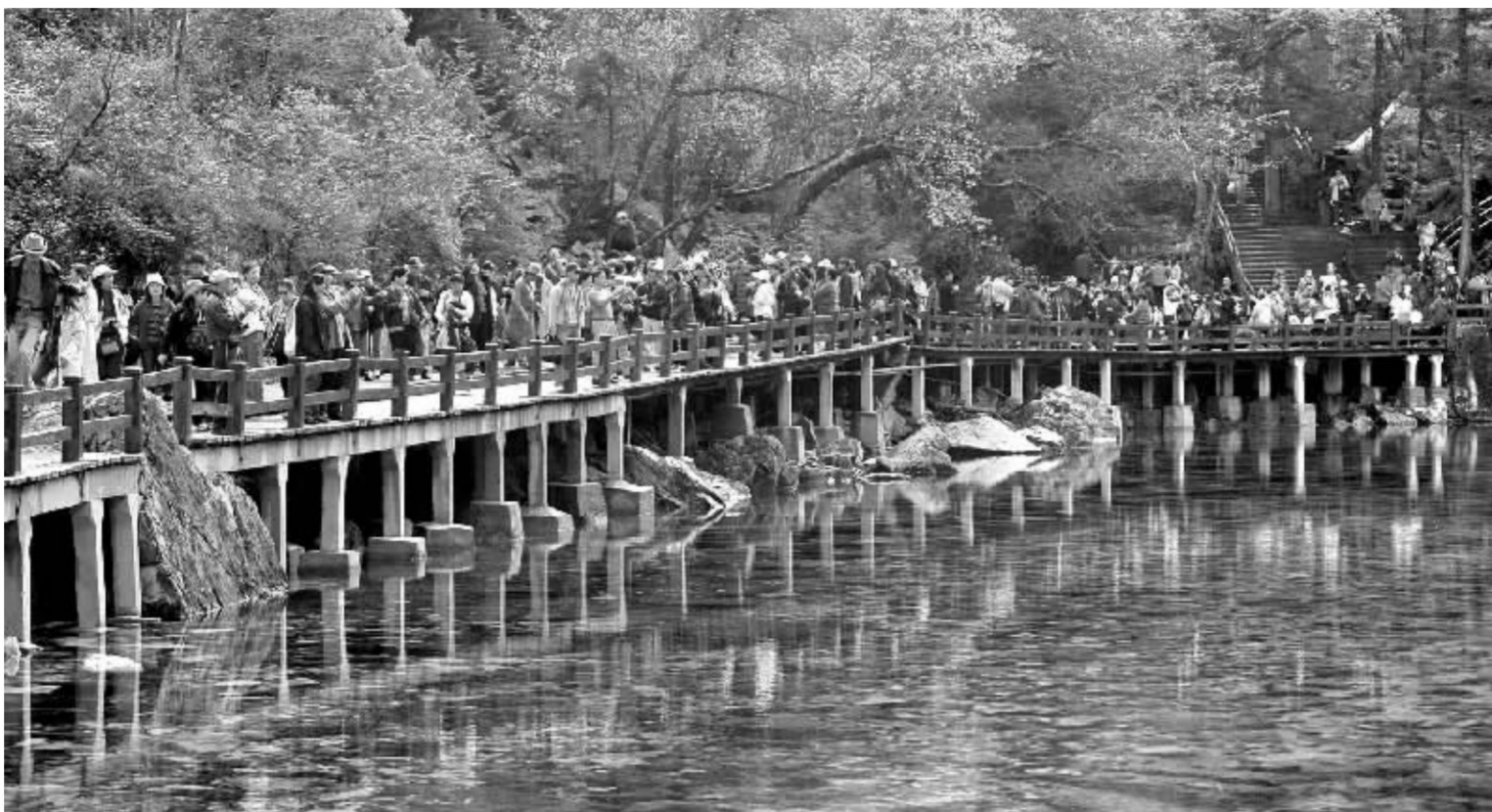
随着人们收入水平的逐渐提高,越来越多的人选择了自助游 资料图

相反,一些旅游城市酒店价格大幅上涨。记者从携程网了解到,十一黄金周期间,三亚、杭州、桂林、厦门等旅游热门景点和城市的酒店价格全线上涨,以桂林为例,当地的五星级酒店价格上涨幅度在25%左右;四星酒店价格上涨幅度为50%左右;三星酒店房价比国庆前贵了80%。