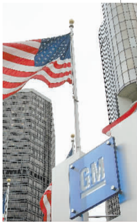
通用汽车世界总部 资料图

不过,根据通用的财报,二季度公司北美部门仍亏损3900万美元,但业绩已经有了很大改进。去年同期,通用公司亏损34亿美元,其中北美部门亏损39.5亿美元。分析师指出,在这样盈利形势大好的节骨眼上,通用无法承受其长期罢工的潜在巨大代价。