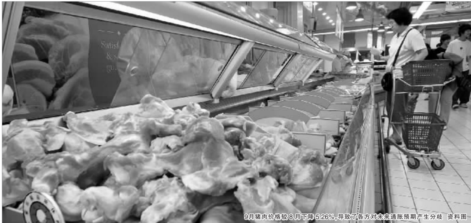
9月猪肉价格较8月下降5.26%,导致了各方对未来通胀预期产生分歧 资料图

报告认为,由于资源价格的上升以及农产品价格震荡上行,即使考虑猪肉等个别商品价格的回落,CPI增幅仍有可能保持在较高水平。