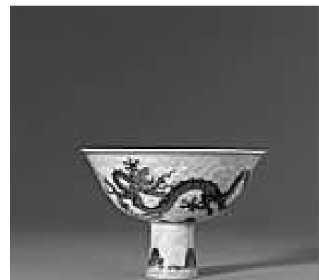
《青花“水波龙纹”图高足碗》

“皇京西暮——清代宫廷艺术珍品，镂月开云-圆明园遗珍”专拍上拍33件，成交率100%，总成交额达到3.22亿元人民币。12件拍品的成交价格超过千万，成交价最高的是最能象征帝皇权威的清乾隆帝《御宝题诗“太上皇帝”白玉圆玺》，经过近5分钟的竞投，最终由场内一名华人投标者以4578.5万元人民币夺得，这个价格也刷新了白玉拍卖价格的世界纪录。其它拍品也拍出卓越成绩，清乾隆《斗彩勾莲纹双螭耳皮球花形扁