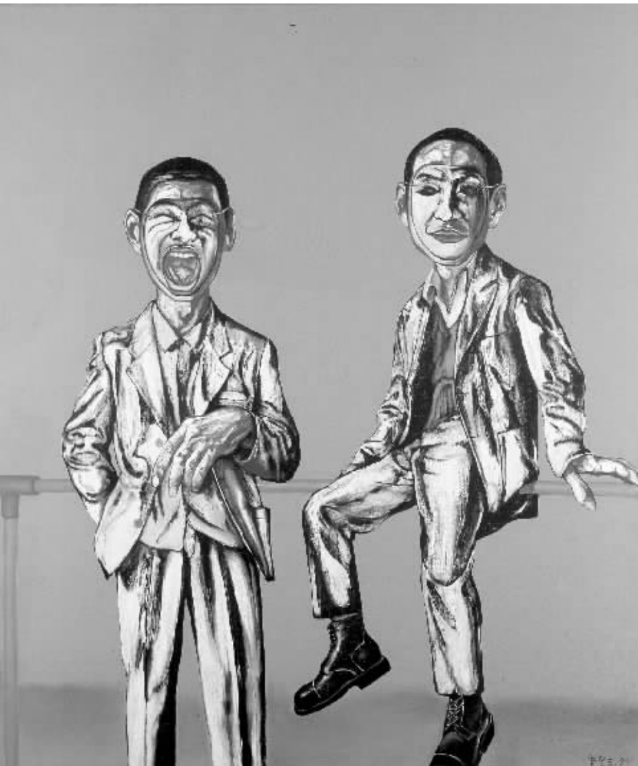
曾梵志 1964年作 面具系列 No.25