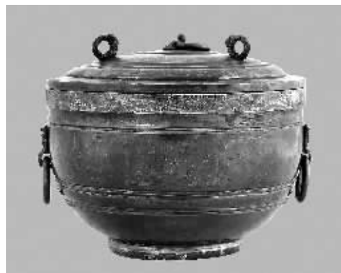
3-东汉彩绘错金银瑞兽纹漆簋

但就此带钩年代，却难以确定是战国还是西汉珍品。有些专家认为带钩上镶嵌白玉，是战国古玉，镶嵌的手法是战国的典型技术，且白玉上的鞞纹，也是战国时期最典型的装饰纹饰。因此带钩是战国时代的产物。但是，也有不少专家认为，带钩上错金银的技术，是西汉早期的技术，所以带钩应该是西汉早期的产物。