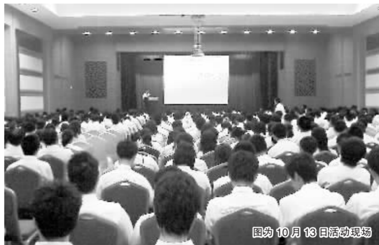
图为10月13日活动现场

部投资者教育渠道,而且还可以将投资者的需求通过网络及时汇集起来,提高了活动的针对性。此外,营