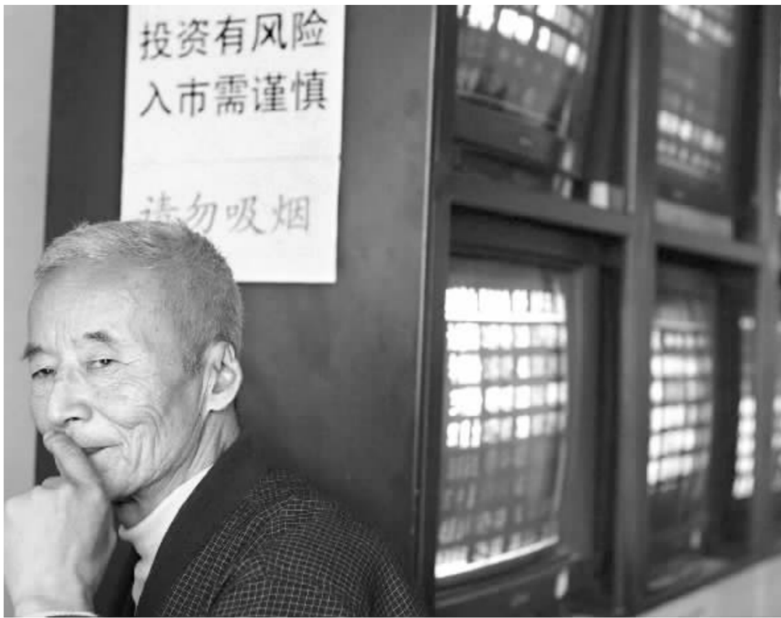
昨日股市震荡下跌,沪指盘中曾跌破六千点整数关口 本报写真图

申银万国认为,大盘经过连续的大幅上扬之后,存在较大的不稳定因素。后市一旦大盘指标股滞涨,股指上涨的速率可能有所减弱,宽幅震荡的可能性较大。并且估值过高的风险开始显现,市场调整已在进行,建议投资者轻仓以待。