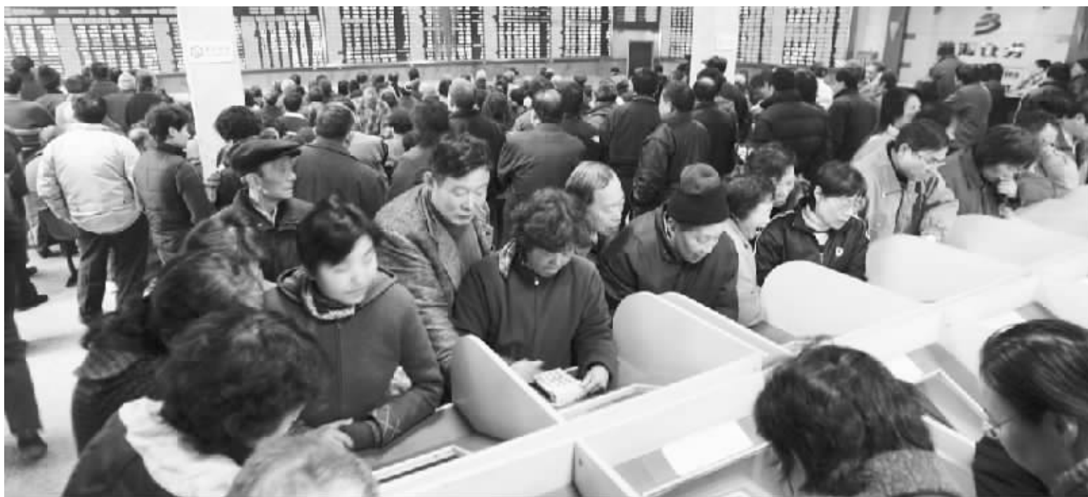
在我国GDP与股市双重强劲增长的情况下,我国富裕人数以及财富持续增加 徐汇 资料图

报告认为,随着亚太市场变得成熟,市场透明度、市场管制、信息披露及风险管理方面得到改善,该区内的富裕人士会将部分现金转为固定收益投资,使投资组合更为多元化且持有相对风险较低的投资类别,对不动产投资配置也可能降低。