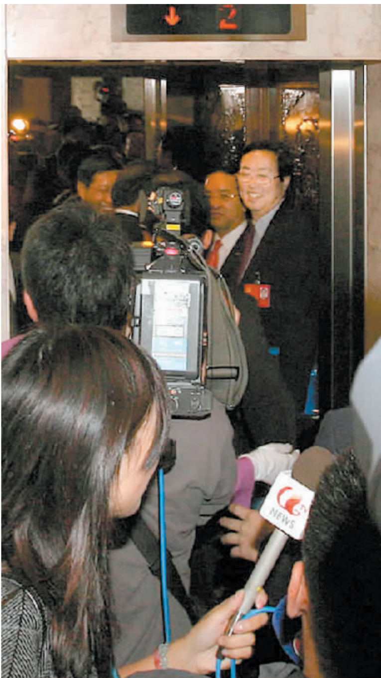
央行行长周小川始终是媒体关注的热点人物。10月16日,出席党的十七大的周小川被记者们堵在了电梯口

在金融宏观调控措施的综合作用下,货币信贷过快增长势头有所缓解,信贷结构进一步优化。截至2007年9月末,广义货币供应量(M2)同比增长18.45%,金融机构人民币贷款同比增速降至17.13%;2003年以来农村金融机构贷款平均增速17.14%,比全部金融机构高