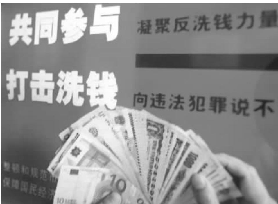
作为反洗钱重要关口,商业银行扮演着极其重要的角色

此后,潘儒民结识了上述另外3名被告人祝素贞、李大明、龚媛,通过多人身份证在上海市多家银行办理了大量信用卡。“阿元”通过非法手段获取网上银行多名客户的工商银行牡丹灵通卡卡号及密码资料后,分1334次将资金划入潘儒民等人办理的67张工行灵通卡中,涉及金额达100万元。上述牡丹灵通卡还被以汇款方式注入资金17.2万元。