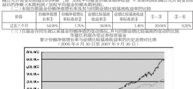
图1: 华夏红利基金资产净值及基金份额净值走势图

主要财务指标和基金净值表现: 截至2007年9月30日, 本基金资产净值为3,199元, 本报告期基金份额净值增长率为54.99%。