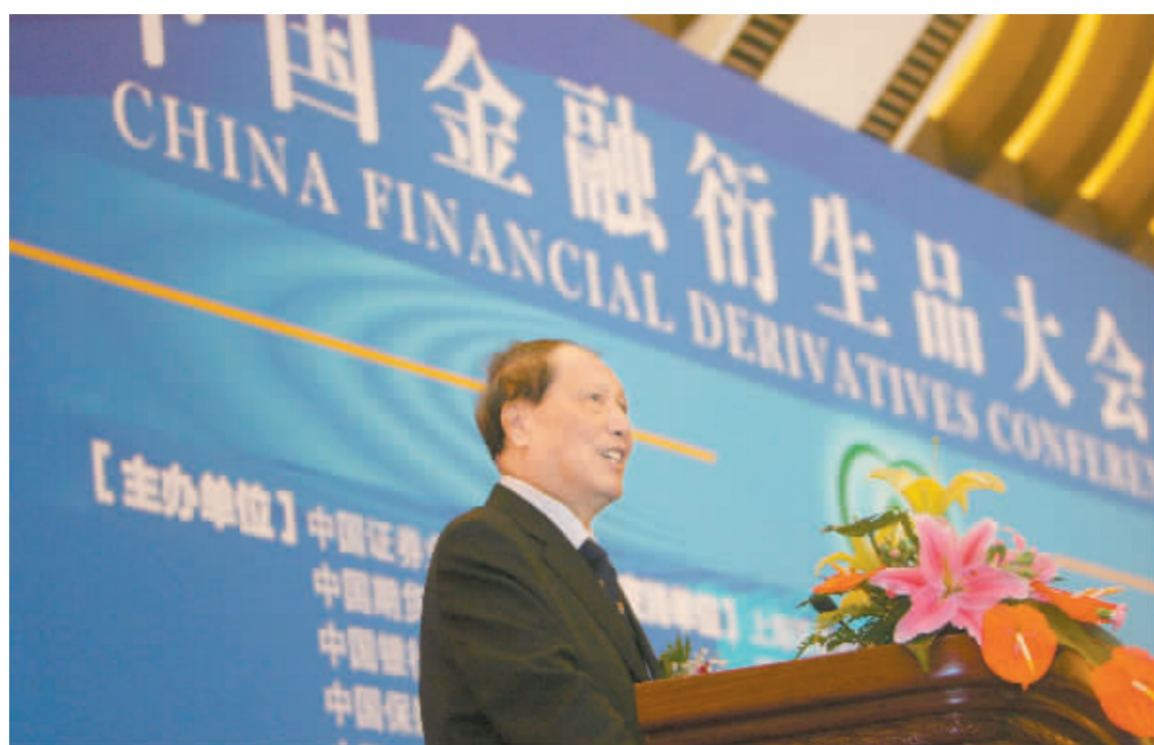
全国人大常委会副委员长成思危在大会上发言

成思危指出,目前我国股市没有做空机制,这就好比一辆车,只有前进档,没有刹车档和倒车档。而股指期货的推出为投资者进行套期保值提供了工具,有利于转移风险。不过,他也提醒,推出股指期货还有一些需要研究的问题,如合约的陈述、入市门槛等。而他主张开始时股指期货的入市门槛要高,防止投资者因一哄而上造成市场混乱。