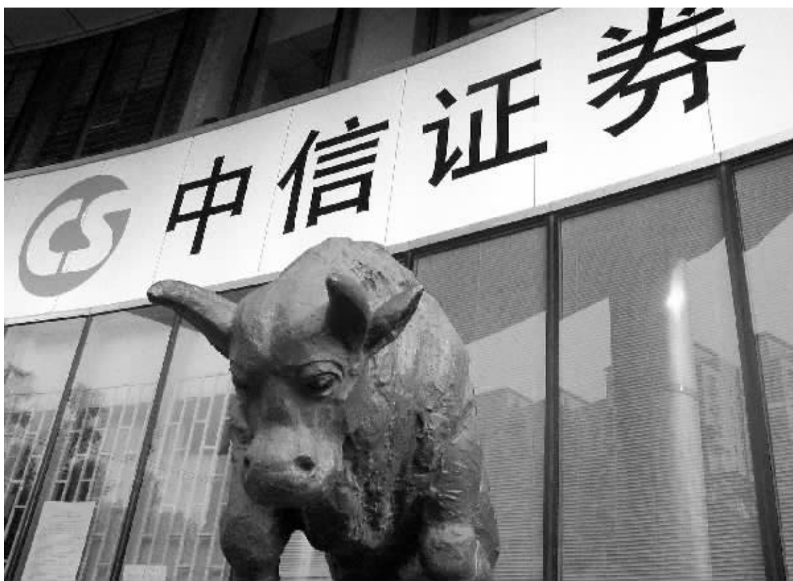
中信证券已经成为保险公司看好的重点投资对象 资料图

国寿积极参与,第三季度买进43308.4万股;交通银行也是新上市股票,中国人寿也买入1624.685万股;新华人寿买进新上市的北京银行617.8万股、南京银行177.612万股;华安财险和平安人寿都参与了宁波银行,分别吃进127.75万股和100.3638万股。