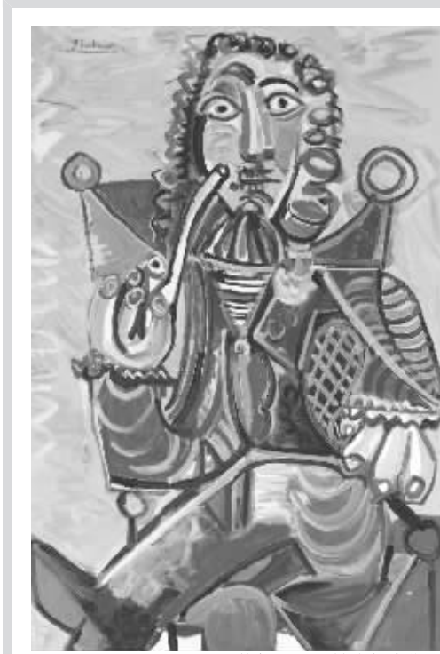
纽约佳士得秋拍毕加索作品

德国表现主义画家弗朗兹·马克的作品《瀑布》估价达到了2000万-3000万美元之间,1999年这件