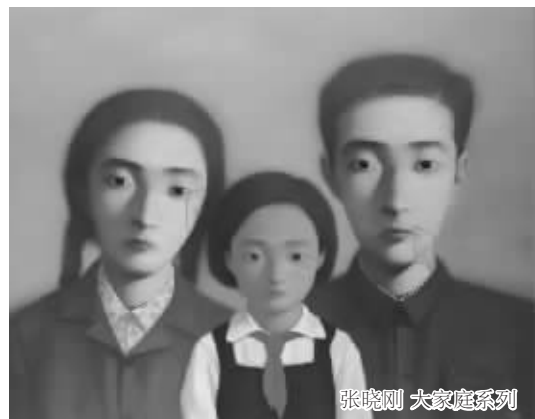
张晓明《大家庭》系列

因此,相比中国当代艺术品的拍卖价格屡创新高,从香港、纽约到伦敦的三大市场的联动效应上分析,可以说中国当代艺术的“全球化”蔓延势头已经显现。