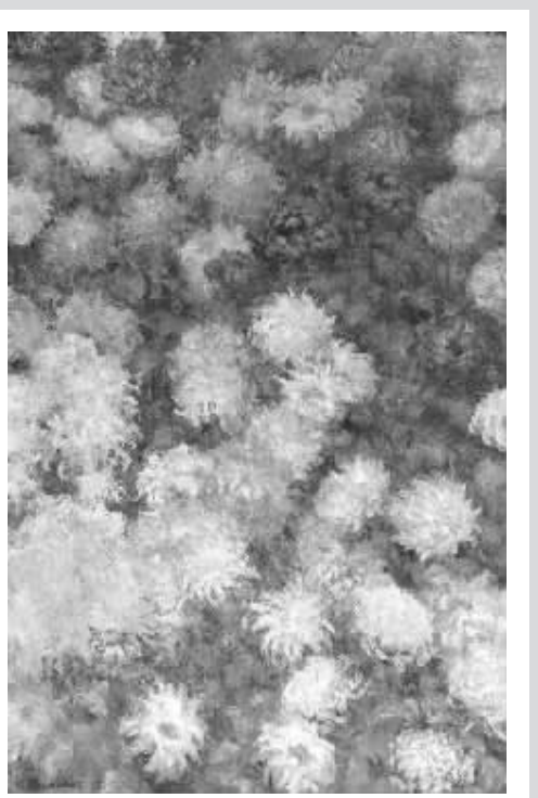
纽约佳士得秋拍莫奈作品