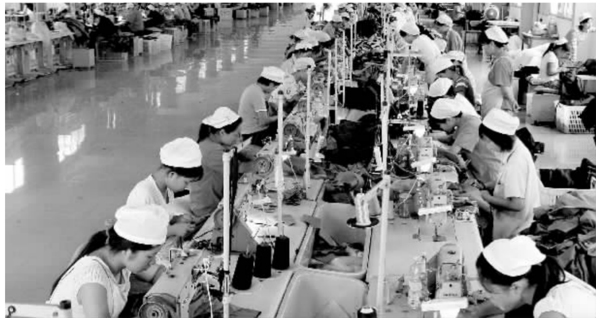
公众关心的年休假与寒暑假、探亲假问题将得到明确 资料图