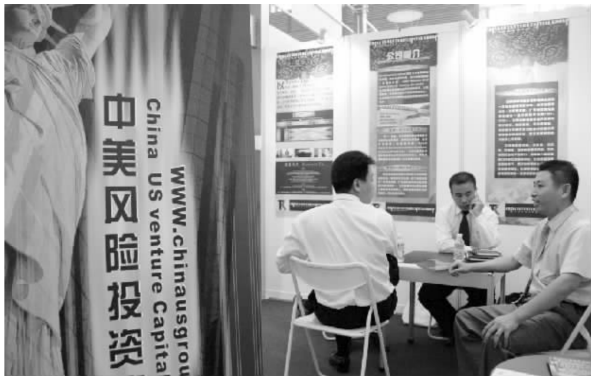
目前,投资机构重点投资发展比较成熟和有潜力的成长性企业