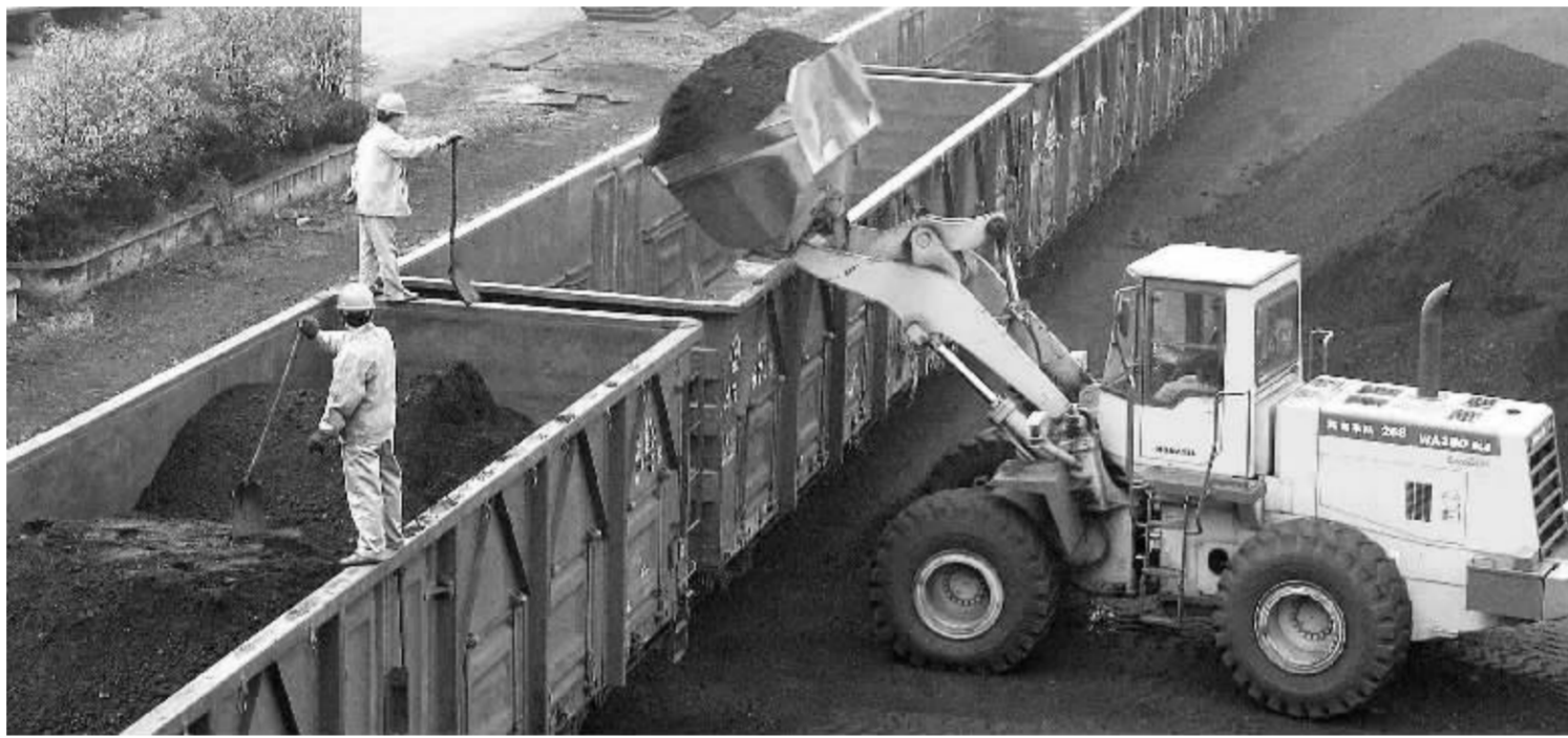
在资源产品价格改革预期下,未来生产资料价格面临继续上涨压力 资料图

10月份工业品出厂价格(PPI)同比上涨3.2%,原材料、燃料、动力购进价格上涨4.5%,双双创下2月份以来的涨幅新高。专家认为,我国PPI向CPI(居民消费价格)的传导将日益体现,通胀压力也将进一步凸显。