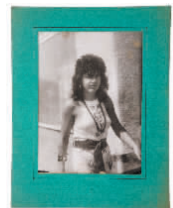
无题 提奇摄影作品

黄燎原介绍，买家们看中的是提奇作品独有的艺术价值和历史价值，尤其是艺术家，他们是真的喜欢提奇的作品，希望能拥有这样的好照片；另外，此次展出的作品价格并不高，多在5500欧元至9000欧元之间也是热销原因之一，精明的藏家们也看到了作品本身的升值潜力——在2004年之前，提奇从不接受展览，也不出售作品，因此提奇的作品在市场上难得一见，据黄燎原预测，明年5月美国蓬皮杜艺术中心将为提奇举办个展，届时提奇的作品必将大涨。1926年出生的米罗斯拉夫·提