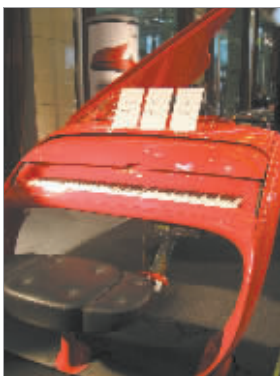
未来钢琴作品