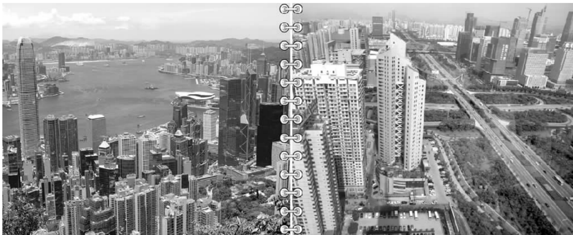
深圳市政府代表团将于下月中旬访问港澳,期间将签署“深港共建国际大都会”、深港创新圈等多项重要协议 张大伟 制图