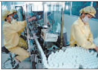
鼓励研发新药 技术可向多家转让