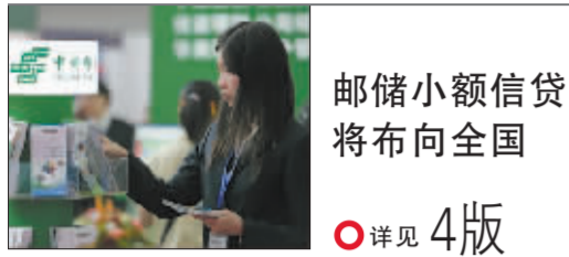
邮储小额信贷 将布向全国