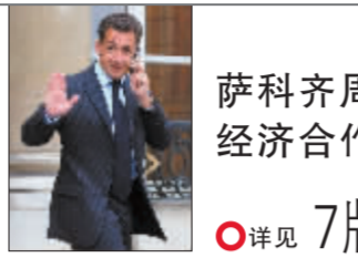
萨科齐周日访华 经济合作成“重头戏”