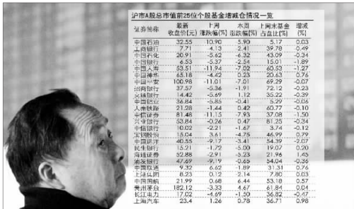
数据来源: www.compass.cn Wind 资讯 俞险峰 制表 郭晨凯制图

据指南针赢富深度行情提供上证所授权Topview数据显示,上周基金在沪市净买入78.23亿元,净卖出54.66亿元,净投入资金23.57亿元。净买入净卖出的交易量合计仅有132.89亿元,这点可怜的交易量与今年10月中旬基金交易高峰时期1432.24亿元相比,还不到十分之一。甚至于,上周的交易量还不及11月12日为保卫5000点而第三度抄底时的交易量,当日基金净买入121.19亿元,净卖出73.46亿元,当天基金净投入资金多达47.72亿元。