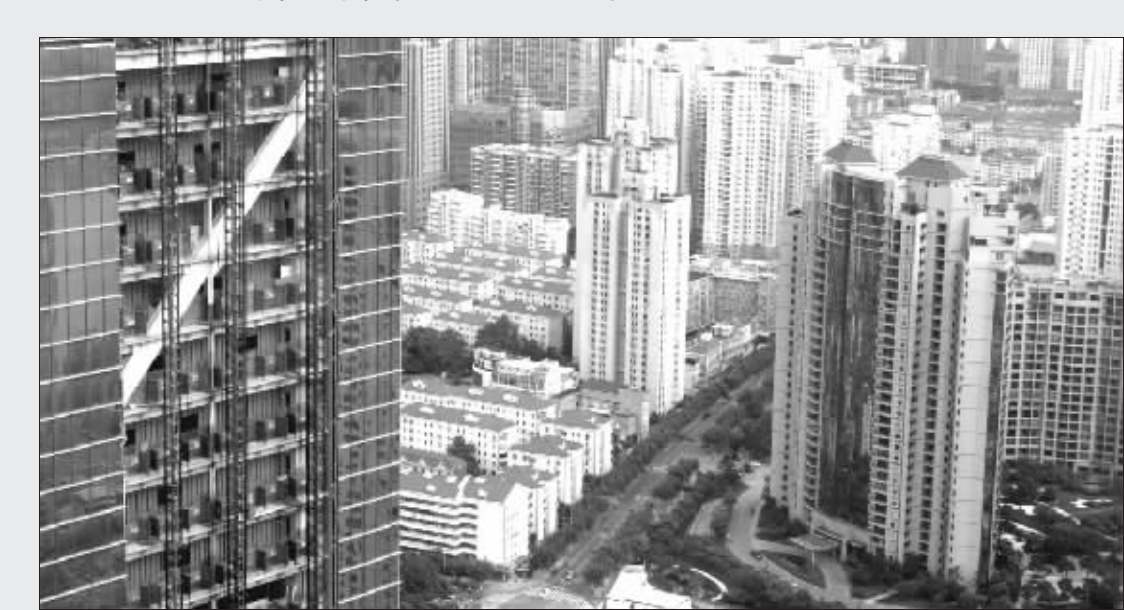
有些公司获得土地的目的,未必是为了即期建设可售房源,只是作为资本市场的融资筹码 徐汇 资料图