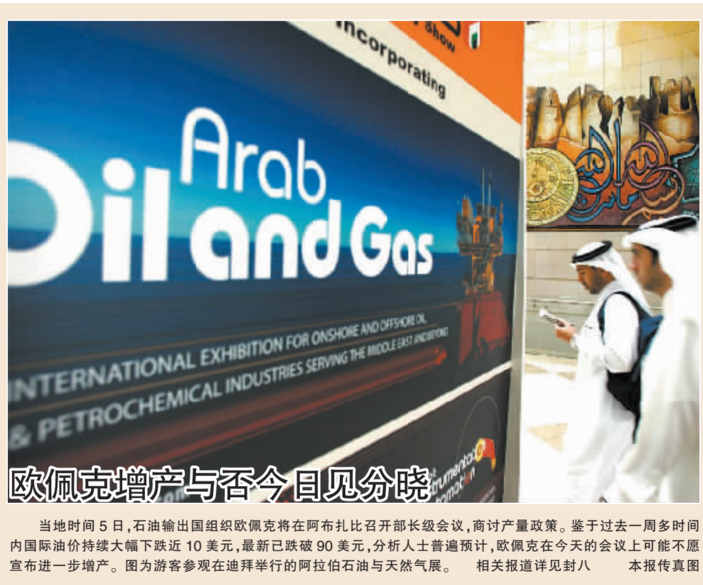
欧佩克增产与否今日见分晓

当地时间5日,石油输出国组织欧佩克将在阿布扎比召开部长级会议,商讨产量政策。鉴于过去一周多时间内国际油价持续大幅下跌近10美元,最新已跌破90美元,分析人士普遍预计,欧佩克在今天的会议上可能不愿宣布进一步增产。图为游客参观在迪拜举行的阿拉伯石油与天然气展。相关报道详见封八