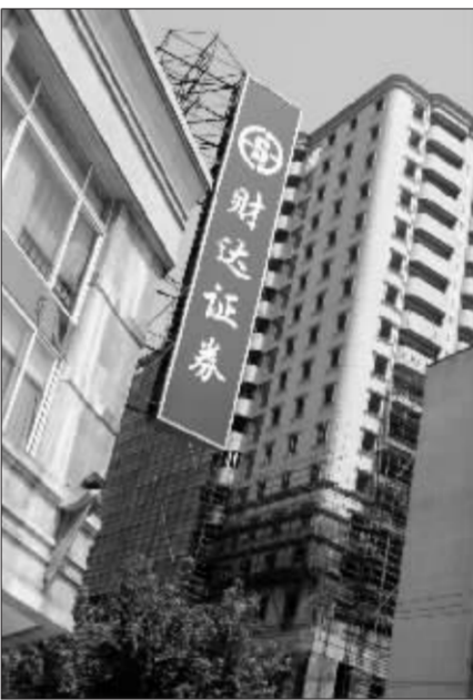
财达证券 徐汇 资料图

财达证券接收河北证券证券类资产后,将成为河北省最大,也是唯一一家证券分公司。业内预计,随着财达证券经纪业务实力的进一步提高,其将借助这一平台,完成向综合类券商的转型。