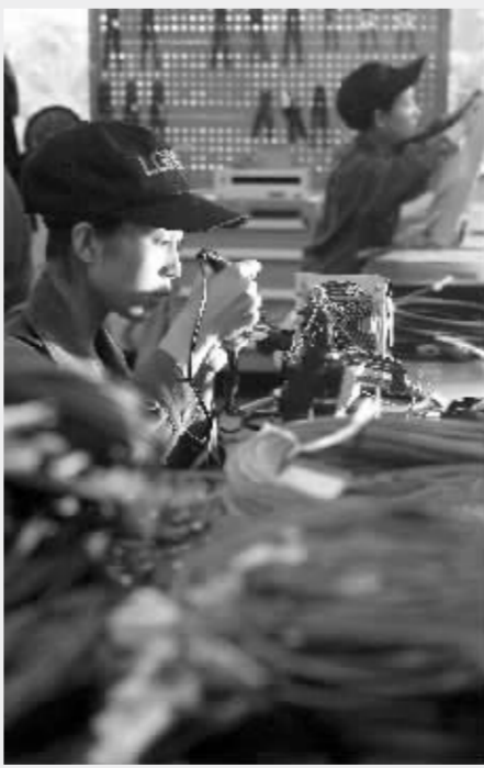
我国将进一步鼓励外商投资研发中心和高新技术产业等 资料图

今年1月-10月我国实际使用外资金额539.95亿美元,同比增长11.15%,基本保持了平稳高速增长态势。薛俊认为,明年加快人民币升值速度可能是有效调控外贸顺差和宏观经济的手段。”人民币缓慢升值对外资企业的影响较小。以外资企业为主的加工贸易收取的是加工费,所以只要劳动力成本没有太大上涨,人民币升值对加工企业的影响远低于对商品进出口的影响,在外资企业成为加工企业主体的情况下尤其如此。”薛俊说。