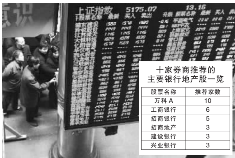
十家券商推荐的主要银行地产股一览