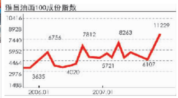
中国艺术市场的走牛或将催生更多的夜场拍卖

件,总成交金额高达3.25192亿元。其中“夜场I”中推出拍品33件,成交率为91%,总成交金额高达1.63968亿元。在作品的成交价格上也相当可观,千万元以上拍品占3件,百万元以上拍品则有29件,占整场上拍数量的88%。其中吴冠中的油画作品《木槿》(1975年作)以3920万元高价落槌,成为该专场的最高成交价,而备受关注的陈丹青作《国学研究院》(2001年作)则以1344万元的高价成交,创出其个人作品成交价格的最高纪录。