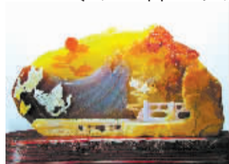
天工奖金奖作品“化蝶”