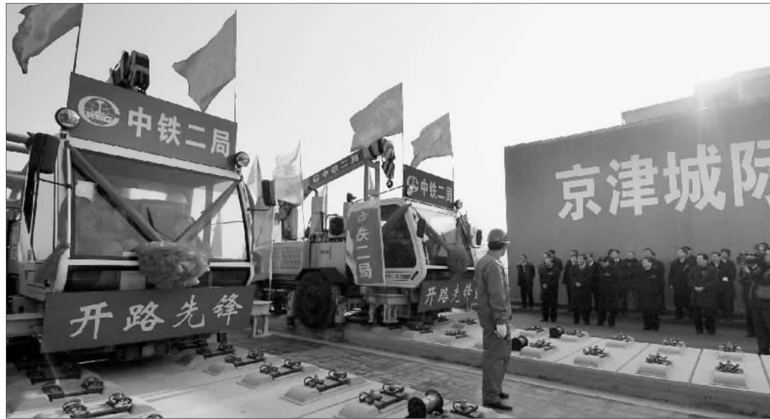
16日上午,京津城际铁路跨天津市新开路立交桥桥头铺下最后一根钢轨

昨天上午,京津城际铁路在跨天津市新开路立交桥桥头稳稳铺下最后一根钢轨,顺利实现全线贯通,标志着我国第一条时速300公里城际铁路建设取得重大进展,为2008年北京奥运会前如期投入运营打下了坚实的基础。该工程2005年7月4日开工建设,2008年初进入综合调试阶段,北京奥运会前正式开通并投入运营。