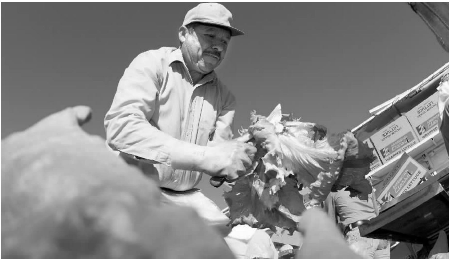
美国农业重要的尤马蔬菜生产基地 资料图

另据了解,世贸组织解决争端机构作出最终裁决一般需花费几年时间。那种裁决可迫使世贸成员修改立法或面临报复性制裁。但美国媒体报道说,新成立的专家组预计 2008 年就美国农业补贴问题作出初步裁决。