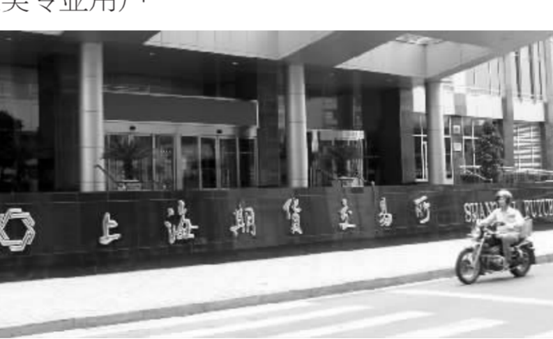
上期所启动黄金期货社会调查 摸底五大类专业用户

上期所有关负责人表示,黄金期货是我国期货市场上市的第一贵金属品种,市场调研是确保黄金期货依照“高标准,稳起步”标准推进上市工作的一个重要环节。在黄金期货获批前,上期所已对国内外市场进行了大量调研,走访多家黄金生产企业、消费企业、贸易商、商业银行、质检机构等,广泛听取了各方意见。黄金期货获批后,上期所发布了黄金期货合约及