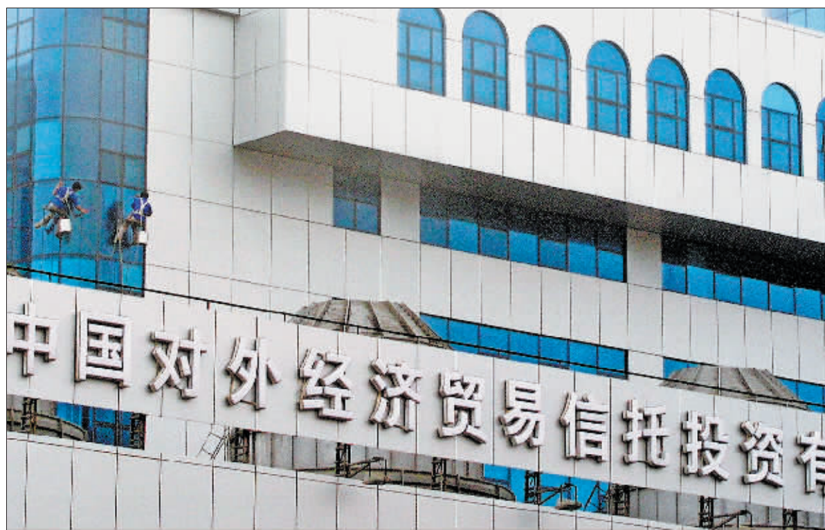
中国对外经济贸易信托投资有限公司 资料图

在这样的大环境下,没有券商背景的期货公司却展开了新的探索,与“阳光私募”的合作就是一例。此前一段时间,一些期货公司与私募基金进行合作,联手信托公司推出了“镶嵌”或是直接针对股指期货的理财产品,