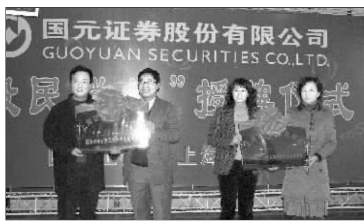
安徽证监局领导为股民学校国元证券九家授课点一一揭牌

同时,国元证券还为投资者教育投入大量的财力与物力支持,仅在投资者教育月活动月期间,就统一编写和发放了《投资者教育手册》、《法制宣传张贴画》等投资者教育资料33000余册。