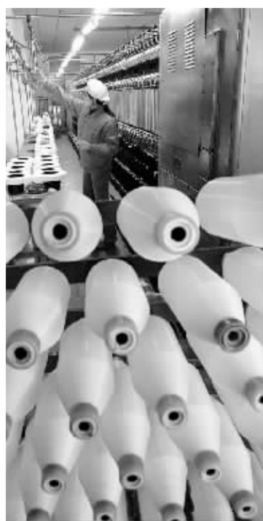
汇率变动将对纺织等出口产品产生一定影响

一些经济学家对人民币汇率改革又提出新见解。雷曼兄弟亚洲经济学家孙明春最近指出,虽然人民币加速升值不可避免,但升值幅度并不是关键,对汇率体制进行完善和改革才是长远之计。在当前形势下,采用新加坡式的钉住名义有效汇率的体制可能是中国汇率制度改革的最佳选择。比如,定期宣布汇率政策的中期目标,但不必公布一篮