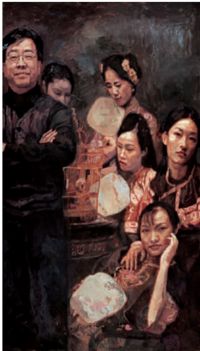
陈逸飞《艺术家与美女》布面油画 165x290

在众多精品中,赵音特别推崇陈逸飞1999年的作品《艺术家与美女》。她指出,陈逸飞一生中只有两件自画像,之前是1979年的巨作《踱步》,都是他的自我表白。这两件作品反映了艺术家一生经历的中国社会转型的两个重要历史阶段:从上世纪70年代末的社会历史的“宏大叙事”转到世纪末艺术家对个人的艺术与美的理想的追求,对个人的美学、哲学观念的表达。这也是他晚期作品的代表作,显示他受到当代艺术的影响,显示他的求新、求变;显示他回国后晚期作品的成熟与豁达。