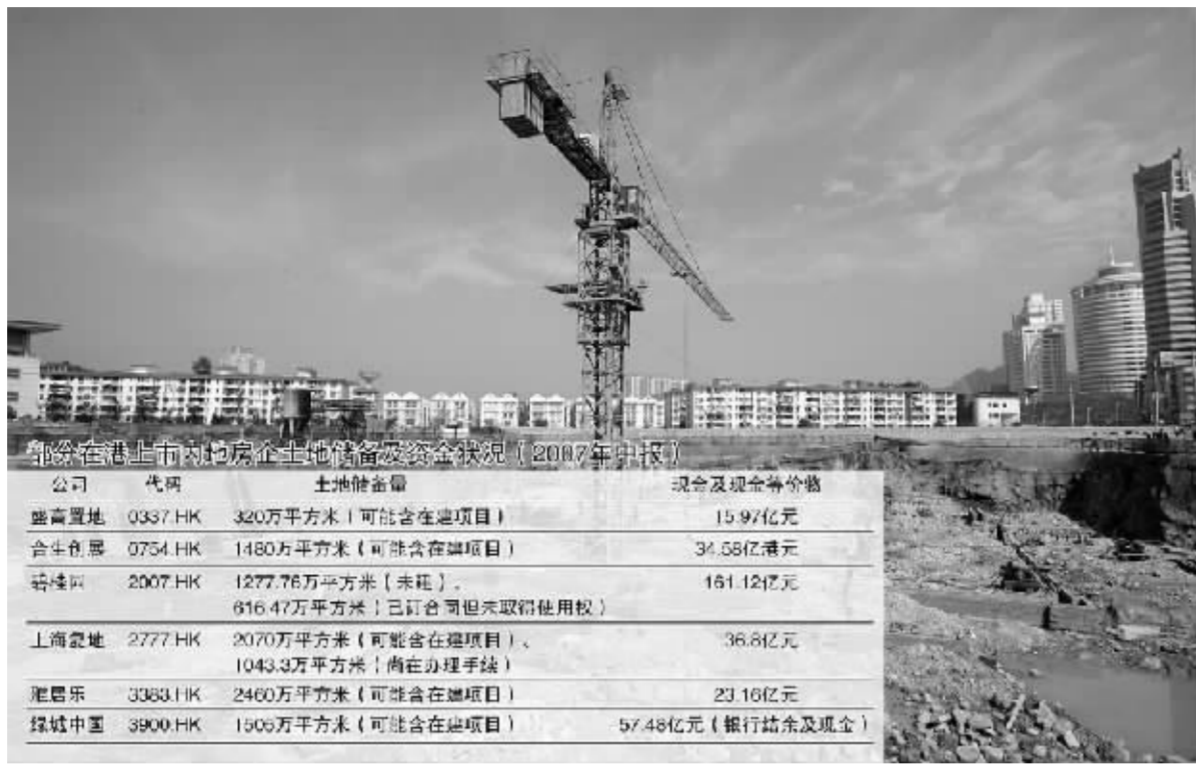
土地储备量与资金量之间的平衡对房企的长远发展将越来越重要 张大伟 制图

“新政对土地闲置满1年不满2年的,就要按照地价征收20%的土地闲置费。一旦真的落实到位,将成为企业巨大的成本压力,超过土地增值税的影响。”分析师指出,“因为对于