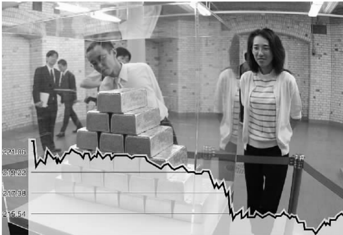
沪期金0806合约走势图 张大伟 制图

市场人士表示,沪期金的溢价大幅消除后,其价格逐步回归至合理区间,长期投资的价值也渐渐显露。尽管沪金昨日遭遇大跌,其持仓量却不降反增,表明获利空头尚未离场,金价很可能还有一跌。 事实上,沪期金昨天的大跌并不出人意料,首日开盘大涨6%以上令上海黄金期货价格直逼1000美元/盎司。一些境外人士认为,中国期货黄金价格大幅高出国际水平,是不合逻辑的。不过,也有分析师认为,中国期金存在一定的溢价可以理解,理由是中国黄金市场相对封闭,进出口受到限制。但值得注意的是,同处上海的国际金交所也可进行黄金买卖,而上海黄金交易所的现货报价与国际金价差距并不大,从这个角度而言,套利资金可以拉平沪期金与上金所现货金之间的价差。 上海黄金交易所主力交易品种Au9995昨天收报205元/克,下跌3.14元;Au9999收报205.60元/克,下跌3.23元。延期递延交割品种Au(T+D)收报204.95元/克,下跌3.11元。