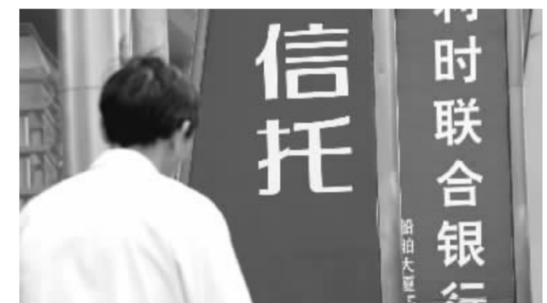
由于信托工具的灵活性,银行合作还有多种模式可以选择 徐汇 资料图

在2007年度中国贸易顺差规模创下新高消息发布的同日,人民币汇率昨天也再度大步走高,1.2672中间价创下汇改以来新高,单日涨幅达133个基点。至此,汇改以来人民币的累计升值幅度达到了11.6%。