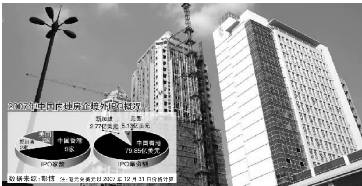
2007年数据显示,香港股市已是内地房企境外IPO活动最重要的舞台。 张大伟 制图

此前,据媒体报道,原本计划于2008年在港上市的内地房企,包括有重庆龙湖、恒大地产、星河湾等多