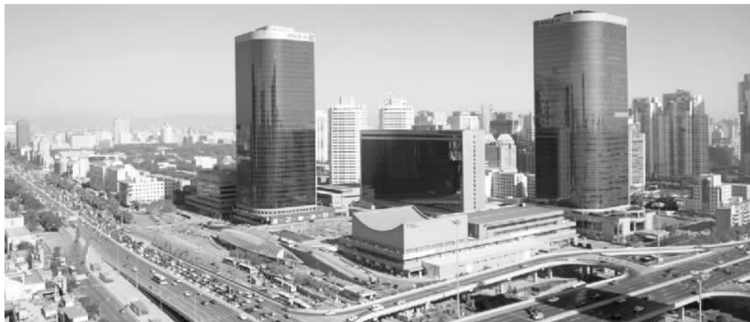
北京市今年经济社会发展目标之一是地区生产总值增长9%、人均地区生产总值超过8000美元 资料图

同时,加强经济适用房的建设和管理,建设300万平方米经济适用房。增加中低价位、中小户型普通商品房供应,重点建设450万平方米“两限房”。