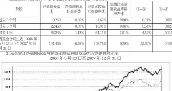
2.基金累计净值增长率与业绩比较基准收益率的历史走势对比图

注: 1)按照基金合同的约定,自基金合同生效日(2006年5月23日)至2007年5月31日,本基金的资产配置比例为:股票资产占基金资产的40%-100%。