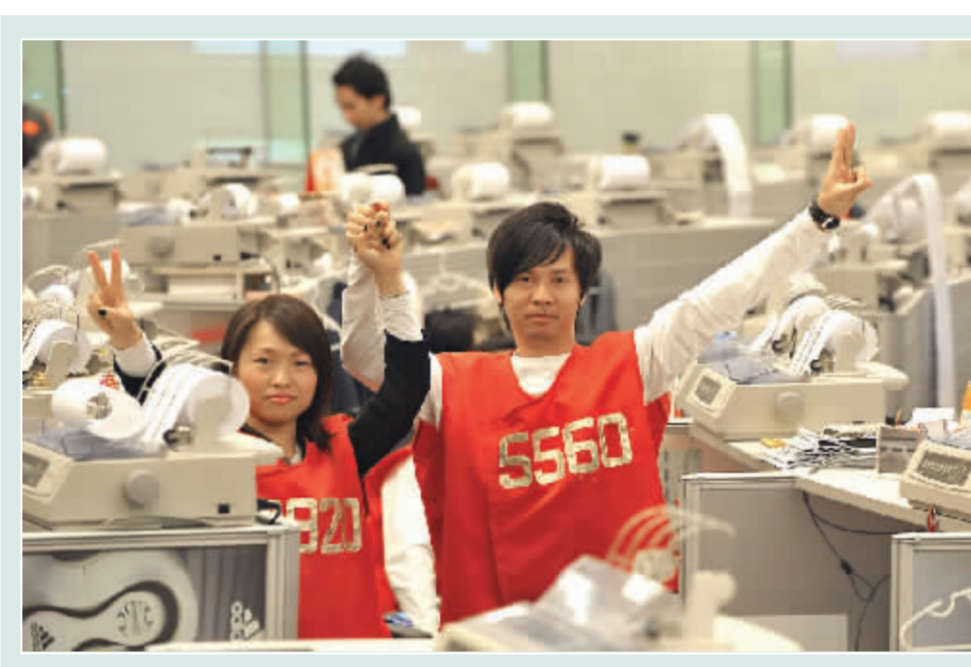
昨日,香港恒生指数大涨2332.54点,涨幅10.72%,创近十年最大单日涨幅和史上最大上涨点数。

针对A股后市,部分机构认为,短期股指下跌空间已经有限,但指数暂时也不具备大幅度连续上行的动力,具体走势仍需视周边股市特别是美国股市的走势情况而定。 相关报道详见封四