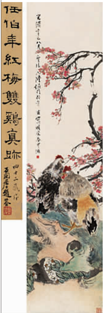
钱镜塘藏品任伯年《红梅双鸡》