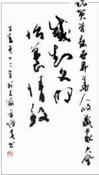
方增先为收藏家大会题字