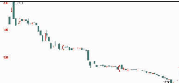
南航认沽权证K线图 晨展 制图

昨日,南航认沽成交放出289亿元的天量,较上一个交易日大增约3.8倍,单日388.92%的换手率也创下上市以来的新高,另外两只认沽证因长时间停牌而成交有所下