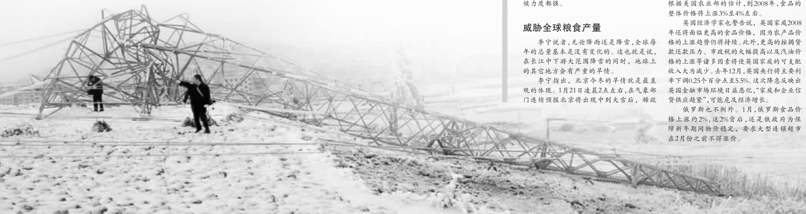
贵州一座连接电网主干线的铁塔因难以承受冰凝重负而被拉断

俄罗斯也不例外。1月,俄罗斯食品价格上涨约2%,这2%背后,还是俄政府为保障新年期间物价稳定,要求大型连锁超市在2月份之前不得涨价。