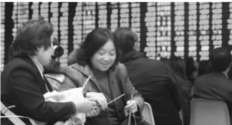
尽管近期市场震荡不止,众多投资者还是打算持股过年 资料图

对于散户年后看好的板块,数据显示,在房地产、外贸、机械、造纸印刷四个明确备选答案中,