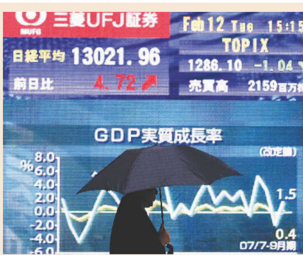
经历数日下跌后,日本东京股市日经225种股票平均价格指数昨日比前一个交易日上涨4.72点,收于13021.96点,涨幅为0.04%。

督促证券公司年内建立风险控制指标的实时动态监控机制的工作也将得到推进。根据部署,有关部门将督促证券公司根据《证券公司风险控制指标管理办法》建立以净资产为核心的风险控制指标动态风险监控体系,同时督促证券公司在年底前完成动态监控系统的建设。