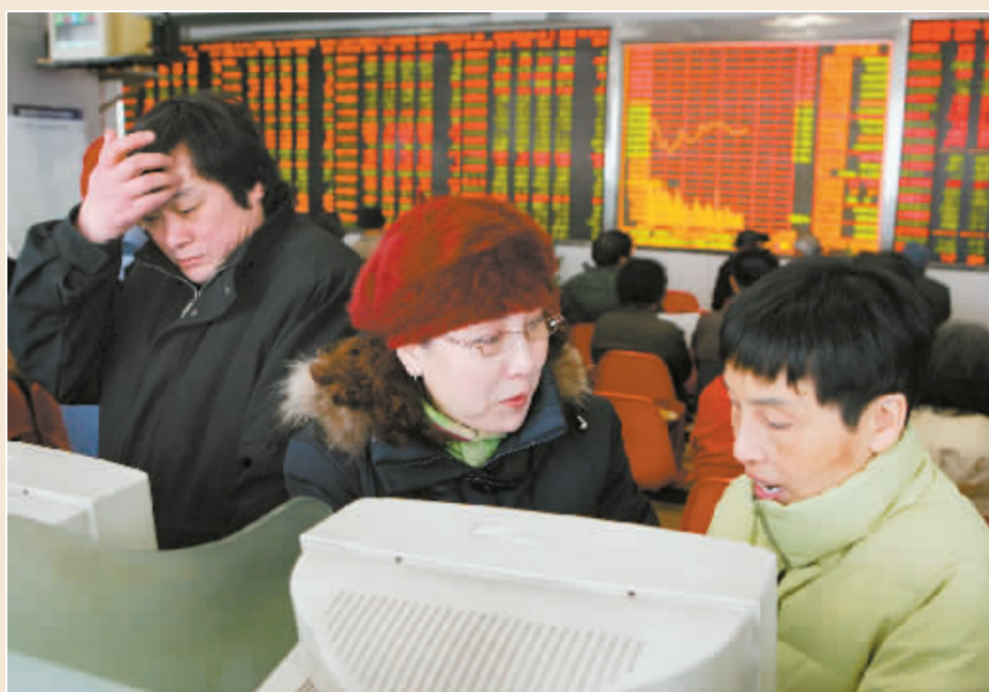
节后首个交易日,沪深股市双双告跌成交锐减。图为上海股民在关注股市动态。

会议要求,各地区、各部门要加强组织领导,明确目标任务,千方百计克服困难,认真落实各项工作措施,奋力夺取抗灾救灾和灾后重建的全面胜利。