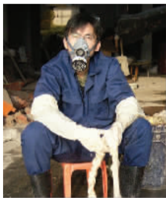
把媒体的反映当创作素材

至于国际性的大展,2001年徐震参加了威尼斯双年展。国外双年展多种多样的艺术形式也触使他联想到一个问题,即面对由欧洲人出资、在欧洲场地上做的展览,中国艺术家该如何面对?如何来理解这样的国际性展览?如何来看待其中所包含的欧洲的游戏规则?“毫无疑问,这是一种‘文化战争’。但我们应该如何参与,如何去改变游戏规则?”